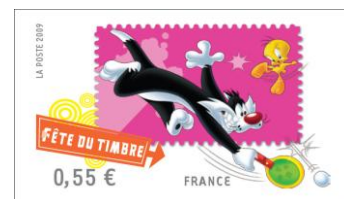
Titi et Gros Minet