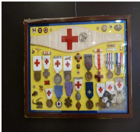
Exposition "La Croix-Rouge"