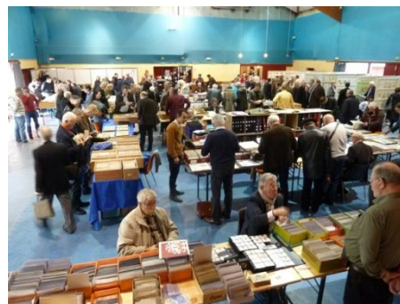
...ainsi qu'une partie des visiteurs