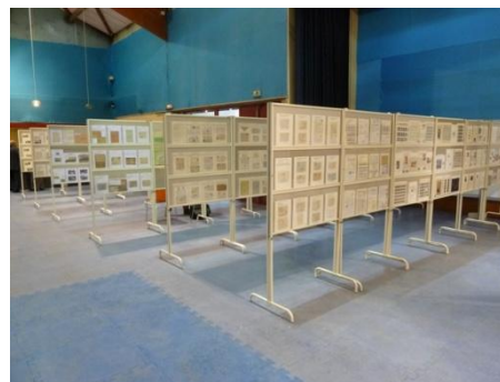
Une partie des cadres d'exposition ...