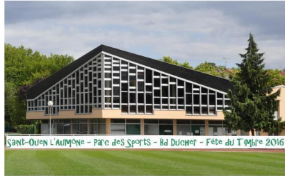
Parc des sports - Bd Ducher St Ouen l'Aumône

Au programme : exposition philatélique compétitive départementale. Edition d'une carte locale ... :