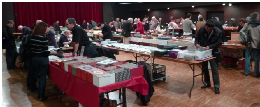
Vue d'ensemble du salon

Ce même jour, une réunion départementale des présidents de Clubs du Val d'Oise était organisée en nos locaux.