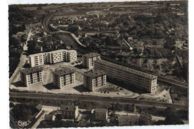
Carte postale représentant la cité Blanche de Castille

Ce nom est souvent évoqué à St Ouen l'Aumône.